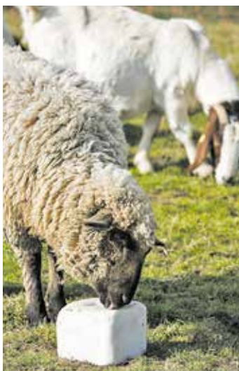
Alle Wiederkäuer benötigen jodiertes Viehsalz z. B. im Form von Salzlecksteinen.

Jeder Wiederkäuer benötigt jodiertes Viehsalz. Ausgewachsene Rinder haben einen Bedarf von etwa 2 bis 3 dag pro Tier und Tag. Die Viehsalzergänzung auf der Weide ist am einfachsten mit Salzlecksteinen umsetzbar.