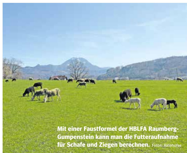
Mit einer Faustformel der HBLFA Raumberg-Gumpenstein kann man die Futteraufnahme für Schafe und Ziegen berechnen.

Größe und der Leistung der Tiere ab. Grob kann man laut Faustformel der HBLFA Raumberg-Gumpenstein mit einer Trockenmasseaufnahme von 3 % des Körpergewichtes rechnen. Ein 80 kg schweres Tier frisst demnach 2,4 kg Trockenmasse Grünfutter. Wenn mit dem Zollstab eine mittlere Aufwuchshöhe von 12 cm gemessen wurde, ergibt das im Frühling einen Ertrag von 112 kg x 12 cm = 1.344 kg TM/ha. Bei einem Durchschnittsbestand von 24 Schafen in Salzburg hätten diese die Fläche in 23 Tagen abgefressen. Diese Zahlen stimmen natürlich nicht ganz, da täglich auch wieder zwischen 0 und 65 kg TM/ha nachwachsen. Bei den angegebenen Werten handelt es sich um Richtwerte, welche natürlich in der Praxis variieren können. Bei einem