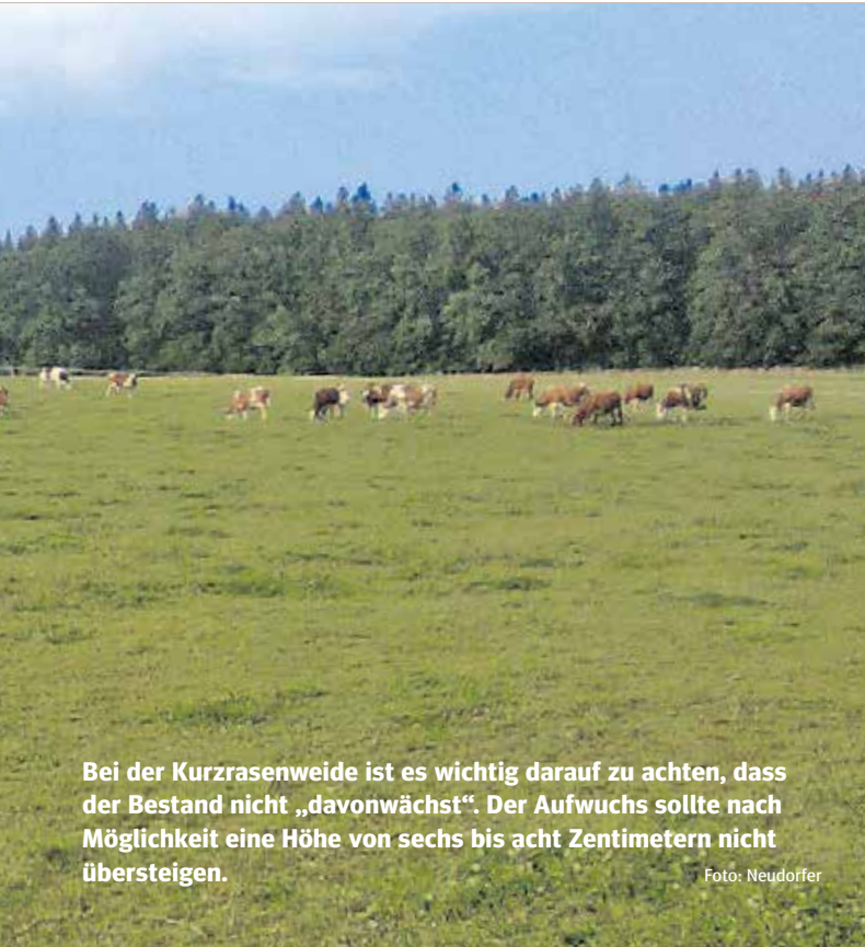
Bei der Kurzrasenweide ist es wichtig darauf zu achten, dass der Bestand nicht „davonwächst“. Der Aufwuchs sollte nach Möglichkeit eine Höhe von sechs bis acht Zentimetern nicht übersteigen.