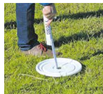
Plastikdeckel eines Eimers mit einem Loch in der Mitte und Zollstab zum Messen

Es kommt vor, dass die Weidedauer bis zu 15 Tage pro Koppel und die Ruhezeit bis zur neuerlichen Beweidung nur zwei Wochen beträgt. Mit zunehmendem Jahresverlauf wird die Weidedauer je Koppel immer kürzer. Auch die Mähflächen dienen nach dem zweiten bzw. dritten Schnitt zur Beweidung.