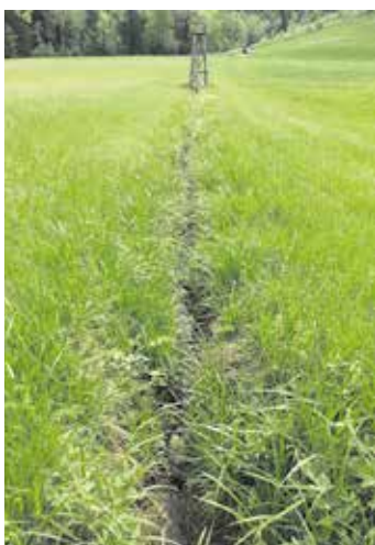
Feuchte Gräben, Bachläufe, Tümpel etc. sind das Habitat der Zwergschlamm- und Schnecke.

werden. Jeder Betrieb muss dabei seine Verantwortung wahrnehmen und nur gesunde Tiere, die keine Hinweise auf Krankheitsanzeichen zeigen, auftreiben. Krankheiten wie zum Beispiel Salmonellen des Rindes oder Paratuberkulose könnten sonst durch den Kontakt auf den Almen von einem Betrieb in andere verschleppt werden. Trotz dieser gesundheitlichen Risiken bietet die Weidehaltung auch viele Vorteile aus der Sicht der Tiergesundheit. Und mit den richtigen Maßnahmen sind fast alle Weideerkrankungen gut zu managen.